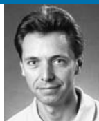
Marc Nicodet, swisstopo