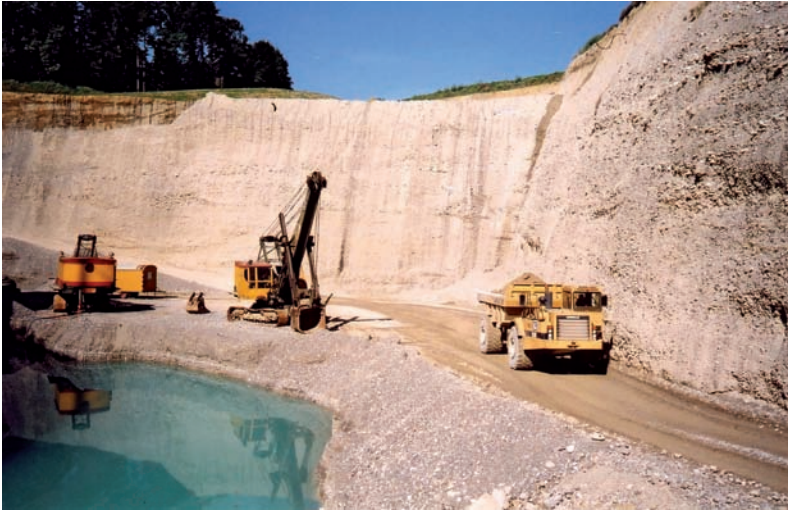
Rohstoffe aus dem geologischen Untergrund: Bsp. Kies und Grundwasser.