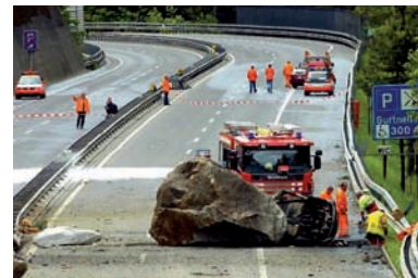
Exposition und Verletzlichkeit unserer Infrastrukturen durch geologische Gefahren nimmt stetig zu.